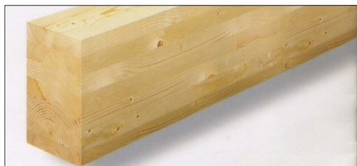
LISTELLI LAMELLARI IN LEGNO DI ABETE