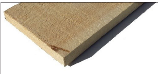
TAVOLE IN LEGNO MASSELLO DI PINO