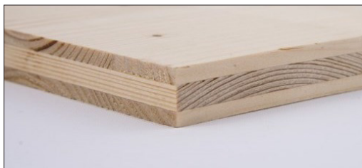
PANNELLO LAMELLARE IN LEGNO DI ABETE A TRE STRATI