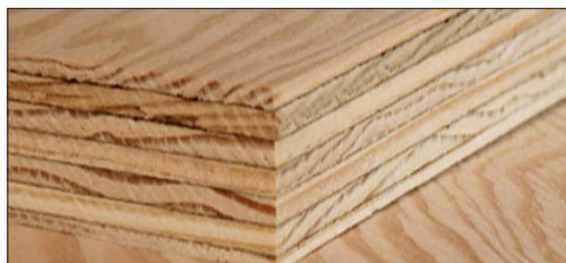
PANNELLO MULTISTRATO FENOLICO IN LEGNO DI PINO (può essere anche indicato genericamente come "coni- fera")