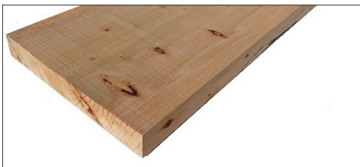
TAVOLE IN LEGNO MASSELLO DI CEDRO