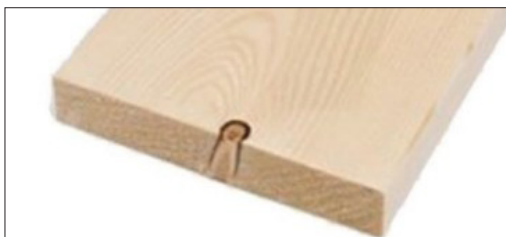
TAVOLE IN LEGNO MASSELLO DI ABETE - ABETE ROSSO