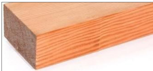
LISTELLI IN LEGNO MASSELLO DI ABETE DOUGLAS