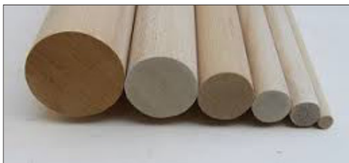
TONDI IN LEGNO DI PINO