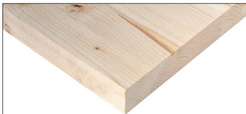
PANNELLO LAMELLARE IN LEGNO DI ABETE - PINO MONOSTRATO