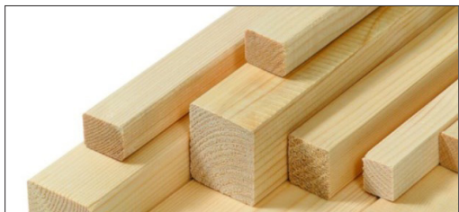
LISTELLI IN LEGNO MASSELLO DI ABETE - PINO - DOUGLAS - ABETE ROSSO