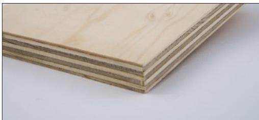
PANNELLO MULTISTRATO IN LEGNO DI ABETE