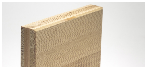
PANNELLO IN LEGNO DI LARICE A TRE STRATI