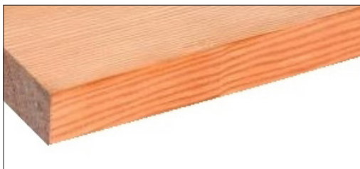
TAVOLE IN LEGNO MASSELLO DI ABETE DOUGLAS