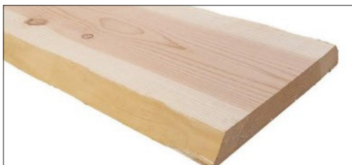
TAVOLE IN LEGNO MASSELLO DI ABETE - PINO - DOUGLAS - ABETE ROSSO