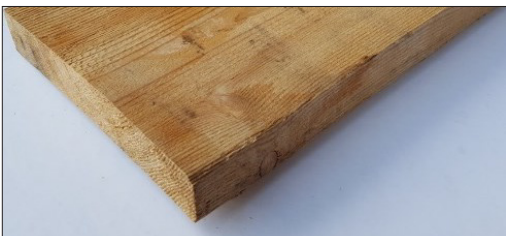
TAVOLE IN LEGNO MASSELLO DI LARICE